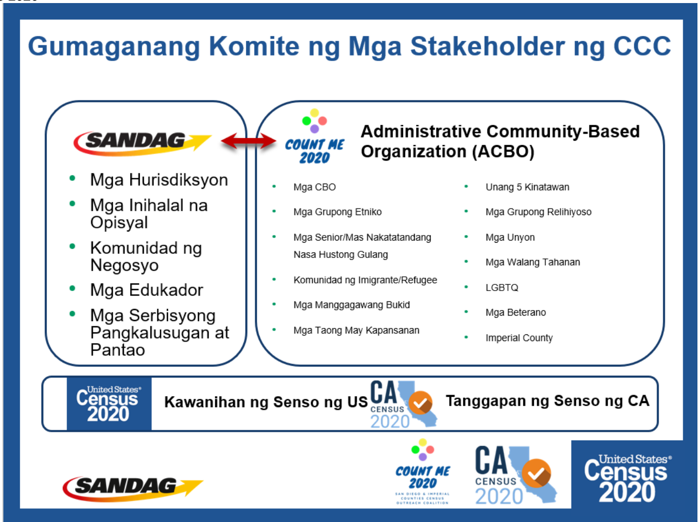
Figura 1: Tsart ng Organisasyon ng Gumaganang Komite ng Mga Stakeholder ng Kumpletong Pagbibilang ng Senso 2020

Ang estratehiya ng outreach ay gagabayan ng Gumaganang Komite ng Mga Stakeholder ng Kumpletong Pagbibilang-ng Senso 2020 5 upang iwasan ang pagdodoble at tiyaking matutugunan ang anumang puwang. Ipinapakita sa Figura 1 ang iminumungkahing istruktura. Titipunin ng SANDAG ang isang grupo na may kinatawan mula sa mga hurisdiksyon, mga naihalal na opisyal, komunidad ng mga negosyante, edukador, mga serbisyong pangkalusugan at pantao, at ng midya. Magtitipon ang ACBO ng isa pang grupo na tutuon sa mga ahensyang pangkomunidad na direktang nakikipagtulungan sa mga grupo na maaaring mahirap bilangin. Lalahok ang SANDAG at ACBO sa parehong grupo, gayundin ang Mga Ispesyalista sa Pagtutuwangan ng Kawanihan ng Senso at Tagapamahala ng Panrehiyong Programa ng Tanggapan ng Kumpletong Pagbibilang ng Senso. Ipinahihiwatig ng pulang arrow sa ibabaw ng Figura 1 ang mahigpit na pagtutulungan sa pagitan ng pagsisikap na pinangungunahan ng SANDAR at ng pagsisikap ng ACBO.